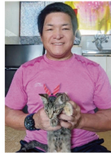
保護猫活動にも参加中。